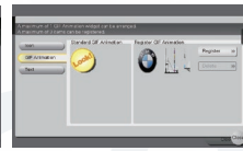
▲ GIF 动画剪辑 选择 / 注册屏幕