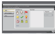
▲ 图标选择 / 注册屏幕